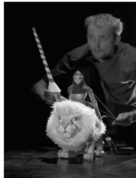
Divadlo Minor: Bruncvík a lev