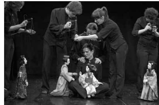
Divadelní a filmová akademie a Hudební akademie Ference Liszta, Budapešť: Mikádo

shodli. I když, pravda, někteří jedinci v skrytu duše doufali v cenu za hudbu spíše pro DNO a „Ledové techno aneb